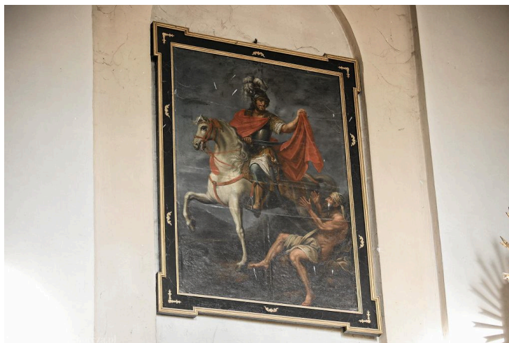
• Odkrywamy Świętokrzyskie. Tarnawa (gm. Sędziszów), kościół św. Marcina, obraz patrona

W głównym ołtarzu znajduje się obraz Matki Boskiej Częstochowskiej w pozłacanej sukience, a po jego obu stronach stoją rzeźby świętych apostołów Piotra i Pawła. Na ścianie nawy wisi m.in. obraz św. Marcina z Tours, pochodzący z poprzedniego kościoła. Przedstawiony na nim patron świątyni i parafii w stroju legionisty na białym koniu podaje część swego płaszcza obnażonemu biedakowi.